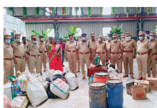
కృష్ణా జిల్లాకు చెందిన 910.905 కిలోల గంజాయిని కూడా ఇదే విధంగా భస్మీకరించారు. డ్రగ్ డిస్పిజిబిల్ కమిటీ (డీడీసీ) చైర్మన్, ప్రొహిబిషన్ అండ్ ఎక్సైజ్

అంతర్జాతీయ మత్తు పదార్థాల వ్యతిరేక అవగాహన వారోత్సవాల్లో భాగంగా చర్యలు విజయవాడ జూన్ 23 (ఆంధ్ర మనం )